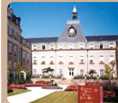
Charité de Sainte Marie